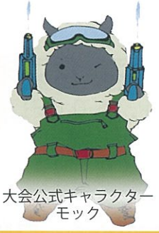
大会公式キャラクター モック

主催 まほら岩手SSB実行委員会 メール ssb@mahora-iwate.com